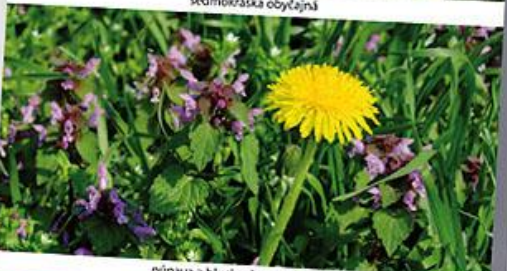
púpava a hlúchavka purpurová

BOFIX selektívny, systémovo pôsobiaci listový herbicíd Dávka na 100 m 2 : 40 - 60 ml Aplikácia: V štádiu dvoch až štyroch listov burín. Na novozaložené trávniky používajte nižšiu dávku.